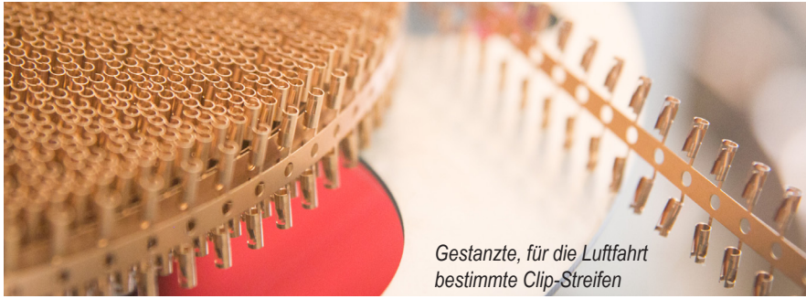
Gestanzte, für die Luftfahrt bestimmte Clip-Streifen

tor. «Ich habe oft festgestellt, dass wir nicht genügend Energie in die Verbesserung der Informationsflüsse investieren: Bisher fehlte uns ein einfaches, werkstattfreundliches Werkzeug.»