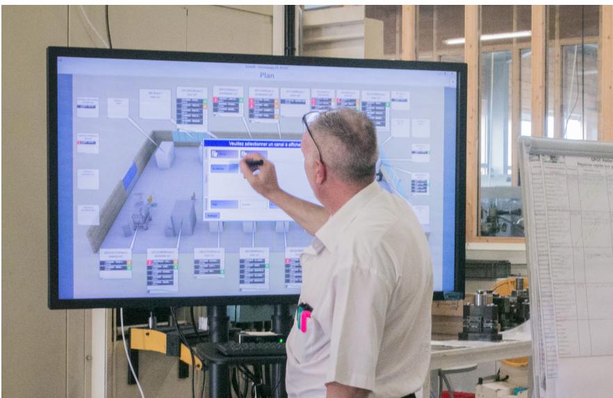
Auf dem Bildschirm sind die aktuellen FA für jeden Arbeitsplatz sichtbar